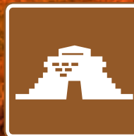
Zona Arqueológica Andes Pucarás de Pambamarca