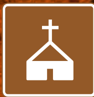
Iglesia Iglesia del Quinche