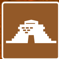
Zona Arqueológica Andes Pucará de Quito Loma