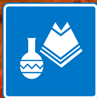
Artesanías Andes Cultura Local