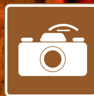
Vista Panorámica Valor paisajístico