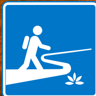
Senderos Capac Ñan