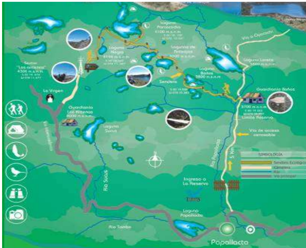
Mapa del sendero ecológico el agua y la vida.

Este sendero inicia en el sector de Las Antenas, una zona de páramo de almohadillas a 4 300 msnm, atraviesa una zona montañosa descendiendo por zonas de humedales, pantano, matorrales, pajonales, y termina en la zona de Baños, en donde se encuentra una guardianía. Aquí se encuentran varias lagunas, como Paracocha, Antejos, Baños, Loreto, Negra, alrededor de las cuales se puede: