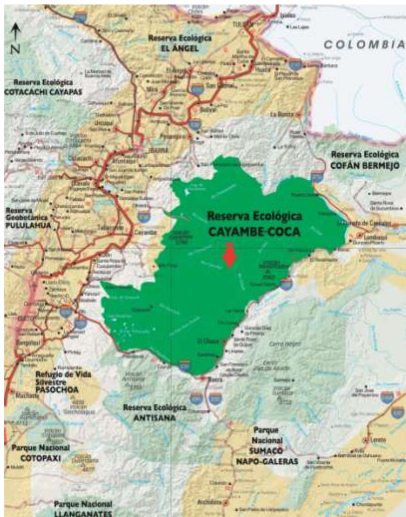
Mapa de ubicación de la RECA.

Dentro de la reserva encontramos comunidades indígenas, como la comunidad Kichwa de Oyacachi en el flanco oriental de la Cordillera de los Andes, y la comunidad Cofán de Sinagué, en la provincia de Sucumbíos.