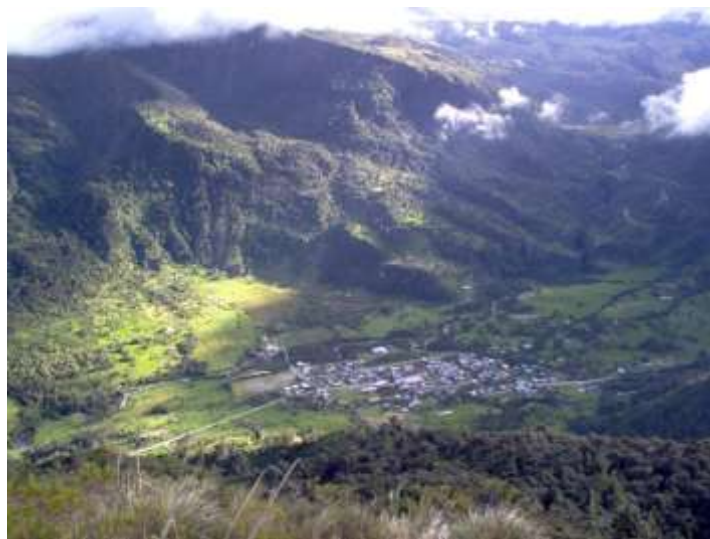
Comunidad de Oyacachi.

La Comuna Kichwa de Oyacachi se asienta sobre un hermoso valle a orillas del Río Oyacachi, a 3200 msnm, y está rodeada de un hermoso paisaje natural: al occidente de la población se encuentra la quebrada de Yamuyacu, al oriente la quebrada Chushi Sacha y las faldas del cerro Pilisurco al norte.