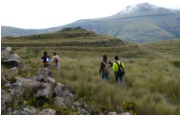
Pucará Cayambi en Pambamarca.