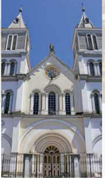
Iglesia San Alfonso