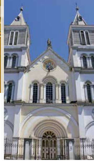
Iglesia San Alfonso