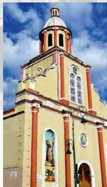
Iglesia San Francisco