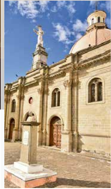
Iglesia La Basílica