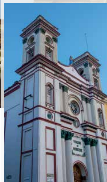
Iglesia La Merced