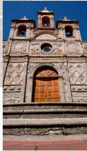
Iglesia La Catedral