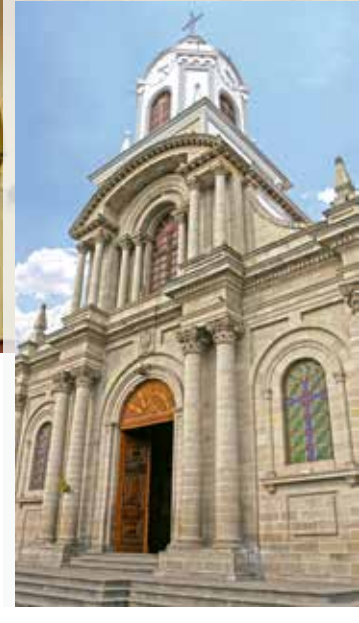
Iglesia San Antonio de Padua