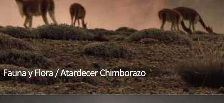
Fauna y Flora / Atardecer Chimborazo